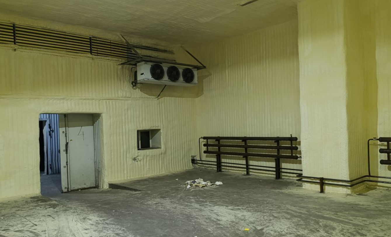
Производственное помещение + офис